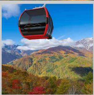
“MT. IWATAKE ROPEWAY”