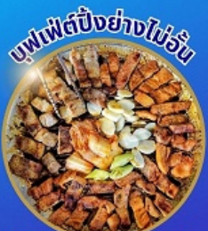
บุฟเฟ่ต์ปิ้งย่างไม่อั้น