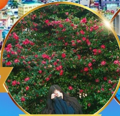
ชมดอกคามิเลีย