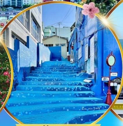
หมู่บ้านริมทะเล