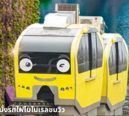
นั่งรถไฟโมโนเรลชมวิว