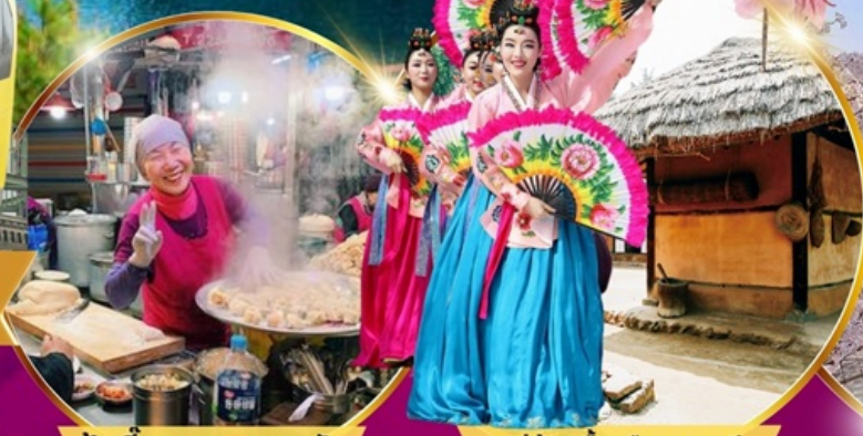
ป่าเกี้ยว ตลาดกวางจง