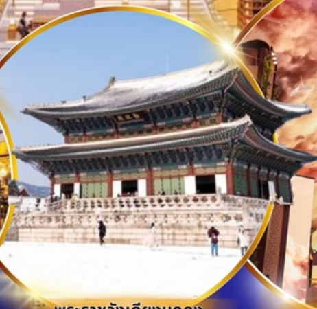
พระราชวังเคียงบกคุง