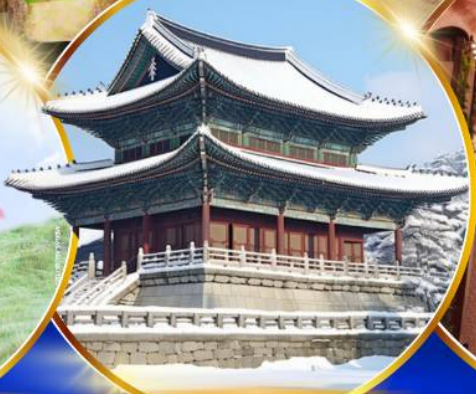
พระราชวังเคียงบกคยอง