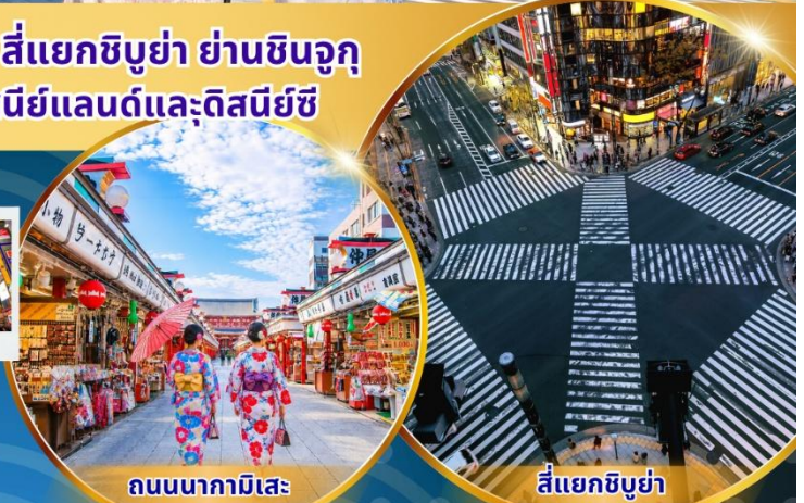
ถนนนากามิसे