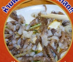
ชั้นนักกีฬา อาหารท้องถิ่น