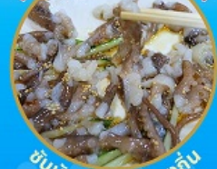
ซินนิทชิ อาหารท้องถิ่น