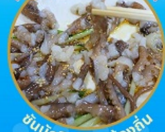
ซินนิทชิ อาหารท้องถิ่น