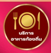
บริการ อาหารท้องถิ่น