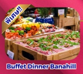
Buffet Dinner Banahill