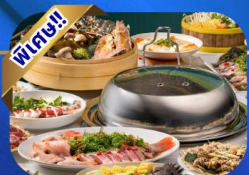
บุฟเฟ่ต์เช้า