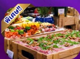
Buffet Dinner Banahill