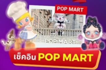
เข้คิน POP MART