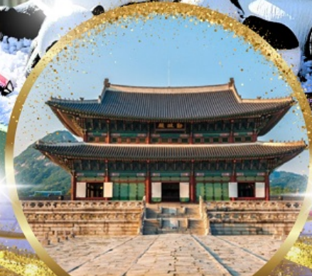
พระราชวังเคียงบกกรุง