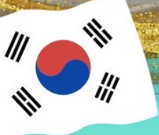
ตลาดกวางจง