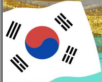
ตลาดกวางจัง