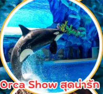
Orca Show สุดน่ารัก