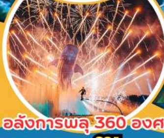
อลังการพลุ 360 องศา