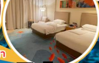
พัก Hengqin Bay 2 คืน!! โรงแรมใกล้สวนสนุก