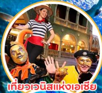
เกี้ยวเวนิสแห่งเอเชีย