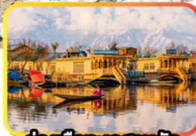
ล่องเรือทะเลสาบคัล