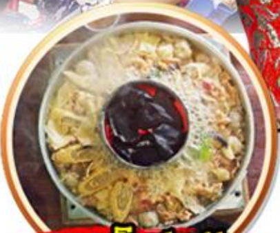
เมนูพิเศษ!! สุกี้เห็ดโตดำ+ปลาเซลมอน