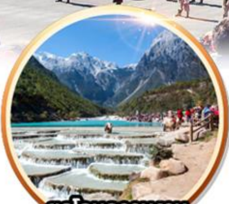
ยอดอมความงาม หุบเขาพระจันทร์สีน้ำเงิน