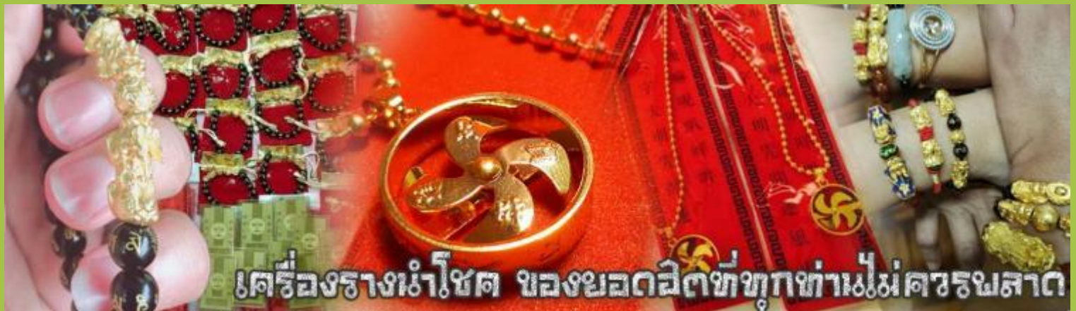
เครื่องรางนำโชค ของยอดฮิตที่ทุกท่านไม่ควรพลาด

จากนั้นนำท่านสู่ ร้านหยก ชมความงามปีเซียะ ที่เชื่อกันว่าเป็นวัตถุมงคลยอดเยี่ยม ที่มีการนำมาบูชา เพื่อให้ช่วยป้องกันสิ่งชั่วร้าย เรียกทรัพย์สินเงินทองให้ไหลมาเทมา และกักเก็บทรัพย์นั้นไม่ให้รั่วไหลออกไปไหนได้ ชาวจีนโบราณเชื่อกันว่า ปีเซียะเป็นสัตว์ประหลาดที่รวมลักษณะของสัตว์มงคลทั้ง 5 ชนิดไว้ด้วยกัน ได้แก่ มังกร พญาราชสีห์หรือสิงโต, อินทรี, กวาง, และแมว โดยตามตำนานเล่าว่า ปีเซียะเป็นลูกมังกรตัวที่ 9 (เทพแห่งโชคลาภ) ของพญามังกรสวรรค์ มีชื่อเรียกด้วยกันหลายชื่อไม่ว่าจะเป็น “เทียนลก (กวางสวรรค์)” เป็นชื่อเดิม ส่วนจีนกวางตุ้งจะเรียกว่า “เผ่ย้า” และคนจีนแต้จิ๋วจะเรียกว่า “ผีซิว” และ ยังมีจำหน่ายยาสมุนไพรบำรุงเพิ่มความแข็งแรงตามความเชื่อของคนฮ่องกง