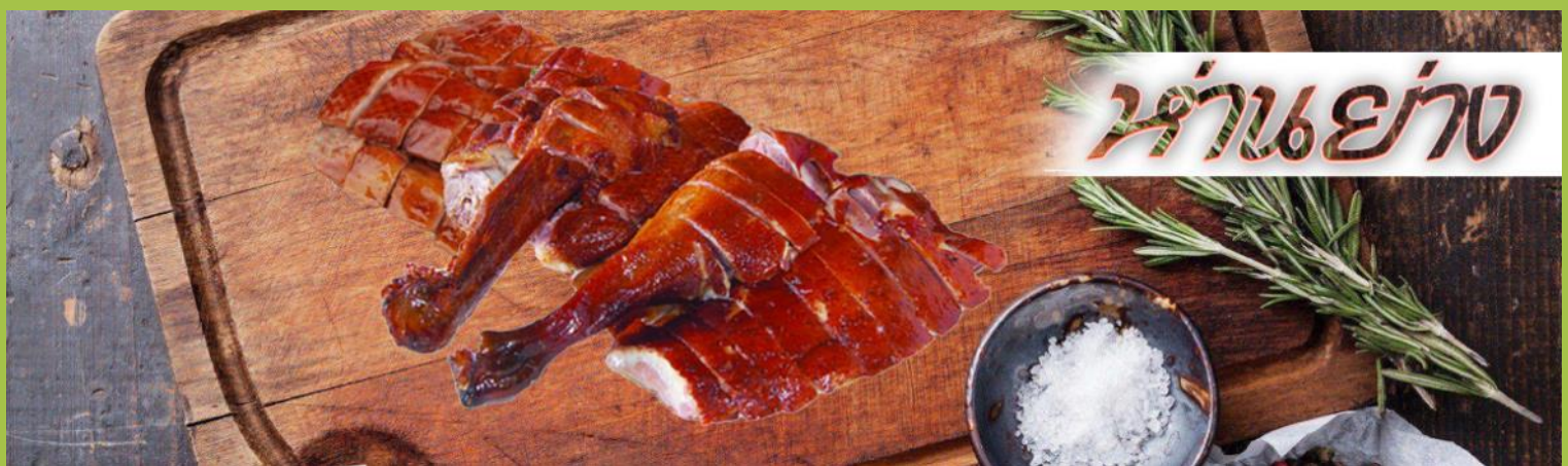
ห่านย่าง

เที่ยง รับประทานอาหาร ณ กัตตาดาร ****เมนูท่านอย่างต้นตำหรับฮ่องกงแสนอร่อย****