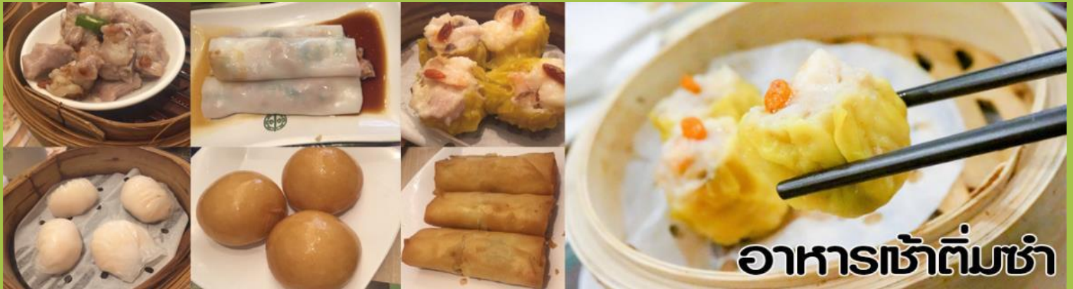
อาหารเช้าต้มซ่า

เช้า รับประทานอาหารเช้า (ต้มซ่า) ณ กั๊ดตาดาร