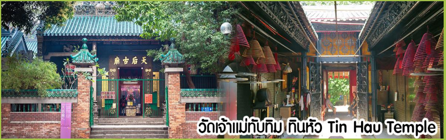
วัดเจ้าแม่ทับทิม ทินหิว Tin Hau Temple