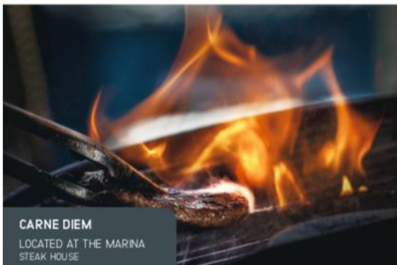
CARNE DIEM LOCATED AT THE MARINA STEAK HOUSE