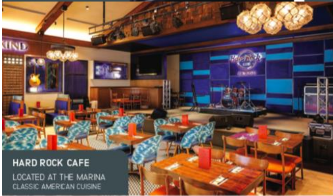
HARD ROCK CAFE LOCATED AT THE MARINA CLASSIC AMERICAN CUISINE