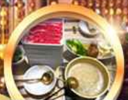
บุฟเฟ่ต์ชาบู เบียร์ไม่อั้น!!