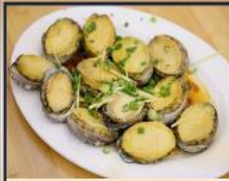
เป่าฮื้อสดนึ่ง