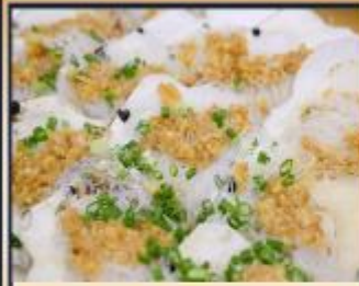
หอยเชลล์อบวุ้นเส้น