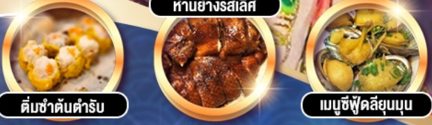
ต้มยำต้นตำรับ | ทานอย่างสละสิทธิ์ | เมี่ยงซีฟู้ดลิ้นจี่ขุนบูน