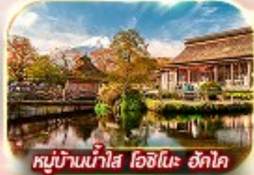
หมู่บ้านน้ำใส โอชิโนะ อักโก