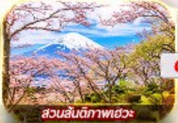
สวนสันติภาพเฮวะ