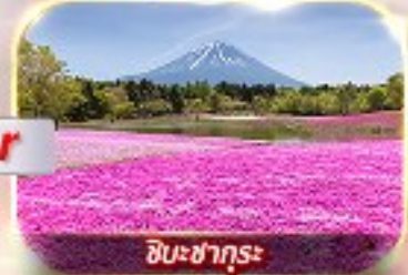
ชิบะซากุระ