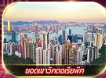
ยอดเขาวิกตอเรือฟ้า