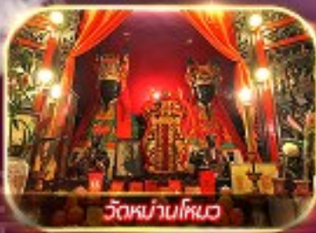
วัดบ้านไผ่