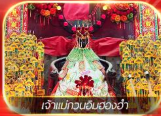
เจ้าแม่กวนอิมสองอ่า