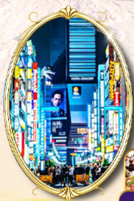
Kawagoe Sagamiko Illumillion Shinjuku