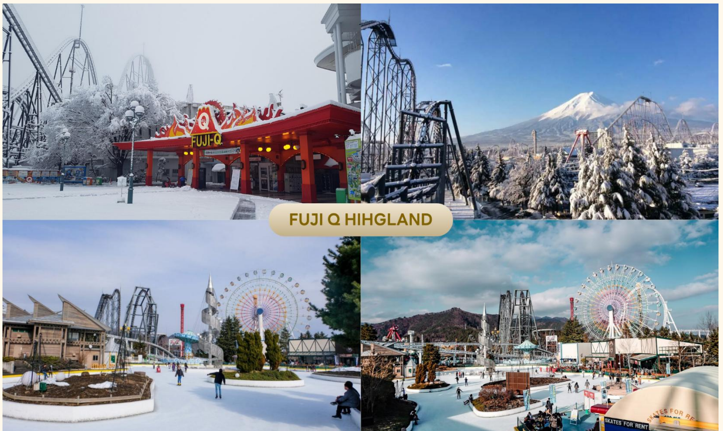
FUJI Q HIGHLAND

นำท่านสู่ สวนสนุกฟูจิติวไฮแลนด์ (Fuji Q Highland) เป็นหนึ่งในสวนสนุกที่ได้รับความนิยมมากที่สุดของญี่ปุ่น ตั้งอยู่ในเมืองฟูจิโยชิเดะ (Fujiyoshida) จังหวัดยามานาชิ (Yamanashi) ประเทศญี่ปุ่น โดยเปิดให้บริการครั้งแรกเมื่อวันที่ 2 มีนาคม พ.ศ. 2511 ดำเนินการโดยบริษัท Fuji Kyuko ซึ่งสวนสนุกแห่งนี้ขึ้นชื่อในเรื่องของรถไฟเหาะที่สูง และเร็วที่สุดในโลกจนได้รับการบันทึกลงใน Guinness Book of Records ที่นี้ยังมีสวนสนุกของตัวการ์ตูนที่มีชื่อเสียงอย่าง “โทมัสแลนต์” และด้วยสถานที่ตั้งของสวนสนุกที่อยู่บริเวณเชิงภูเขาไฟฟูจิ แถว ๆ ทะเลสาบคาวากูจิโกะ ทำให้เวลาเล่นเครื่องเล่นในสวนสนุกฟูจิติวไฮแลนด์ ท่านจะได้เห็นวิวฟูจิขังด้วย (ราคาทัวร์ไม่รวมค่าเครื่องเล่น)