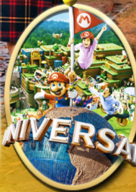
อิสระเลือกซื้อบัตร Universal Studios Japan

รหัสทัวร์ RJ-XJ140 เดินทาง 6D 4N 18 - 23 ต.ค. 69