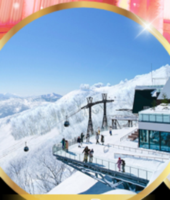
จุดชมวิวก Unkai Terrace