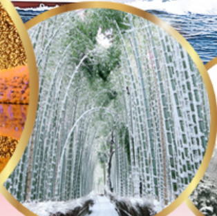
ป่าไฟ อาราชิม่า