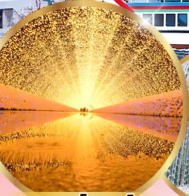
นาบาระ โนะ ซาโตะ