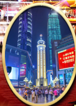
ถนนคนเดินเจียฟางเป็ย