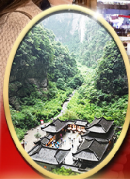
อุกยานหลุมฟ้า สะพาน สวรรค์