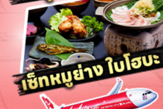
เช็กเมนูย่าง ไบโอะ

ราคาเริ่มต้น 29,919 บาท รวมภาษีมูลค่าเพิ่ม 7%