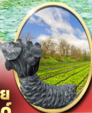
ฟาร์ม วาซาบิ ไดโอะ