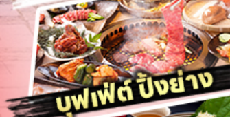
บุฟเฟต์ ปังย่าง