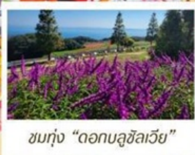
ชมทุ่ง "ดอกบลูซิลเวีย"