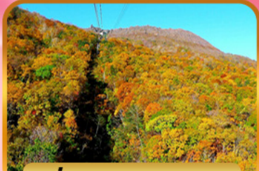
นั่งกระเช้าอุซุซัง