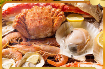
บั้งย่างร้านดังนั้นตะ