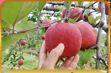
เก็บแอปเปิ้ล

พิกัด 4 ดาว ★★★★★ HAKODATE KOKUSAI HOTEL 1 คัน TOYA SUN PALACE 1 คัน JOZANKEI VIEW HOTEL 1 คัน SAPPORO STREAM HOTEL 2 คัน