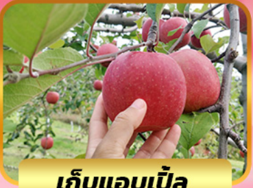
เก็บแอปเปิ้ล