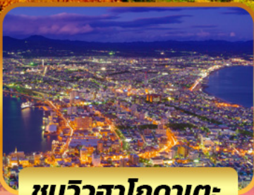
ชมวิวฮาโกดาเตะ