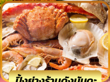
บิงย่างร้านดังนั้นตะ