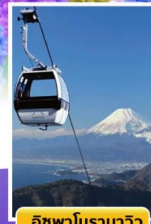
อีซูฟาโบราณาวิว