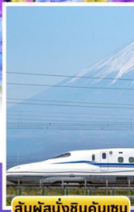
สัมปั่งนั่งชินคันเซน