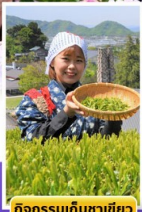
กิจกรรมเก็บชาเขียว