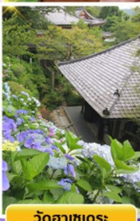
วัดฮาเซเดระ