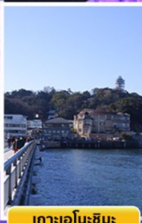
เกาะเอโนชิมะ