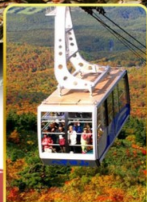
นั่งกระเช้าอากิโกะ