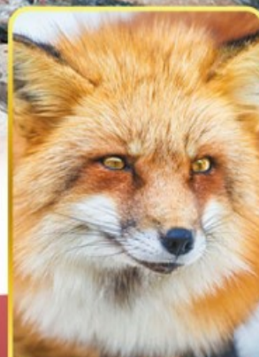
ฟาร์มสุนัขจิ้งจอก