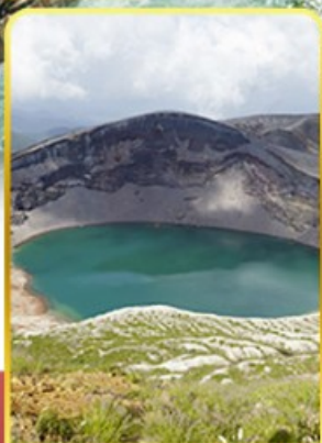
ปากปล่องภูเขาไฟฮาโอะ