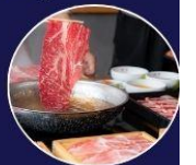
ปิ้งย่างพรีเมียม ROKKASEN เนื้อคุณภาพ