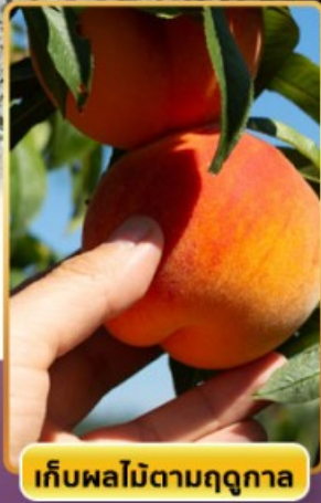
เก็บผลไม้ตามฤดูกาล

ออนเซ็น 3 คืน นน.กระเป๋า 23 กก. 8Days 5Night