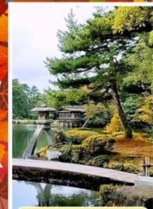
สวนเคนโรคุเอ็น

ออนเซ็น 3 คั้น นน.กระเป๋า 23 กก. 7Days 5Night