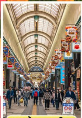
ช้อปปิ้งทานุกิโคจิ