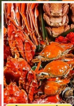
ปิ้งย่างพรีเมียม