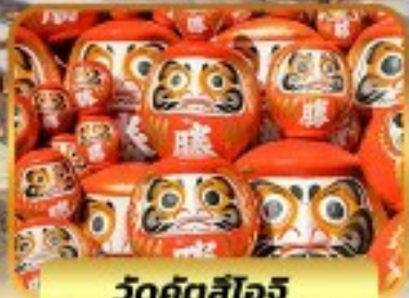
วัดคังสึโงอิ