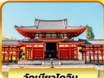
วัดเบียวโดอิน