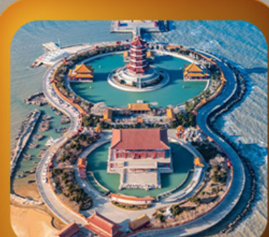
“แปดเซียนข้ามทะเล”

เสน่ห์เมืองชายฝั่งจินตตอนเหนือ • เวบีสระวันออก • เก็บผลไม้ ณ สวนต้าเหลียน เมืองเหยียนโต • ท่าเรือไห่ซาง ปลายวาฟกยตัน • เมืองเฝิงไหล • แปดเซียนข้ามทะเล เมืองเว่ยไห่ • ถนนคอบเพลิงเลว 8 • ซากเรือบลูเวย์ • Korean Town • หมู่บ้านซาจื่อโจว สะพานจันเจียว • โบสถ์เซนต์โมเคลิ • พิพิธภัณฑ์เบียร์ชิงเต่า • อ่าวฝูซานวาน