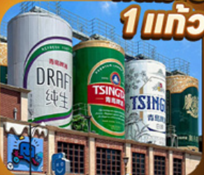
“พิพิธภัณฑ์เบียร์ชิงเต่า”

เสน่ห์เมืองชายฝั่งจินตตอนเหนือ • เวบีสระวันออก • เก็บผลไม้ ณ สวนต้าเหลียน เมืองเหยียนโต • ท่าเรือไห่ซาง ปลายวาฟกยตัน • เมืองเฝิงไหล • แปดเซียนข้ามทะเล เมืองเว่ยไห่ • ถนนคอบเพลิงเลว 8 • ซากเรือบลูเวย์ • Korean Town • หมู่บ้านซาจื่อโจว สะพานจันเจียว • โบสถ์เซนต์โมเคลิ • พิพิธภัณฑ์เบียร์ชิงเต่า • อ่าวฝูซานวาน