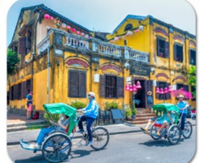
"เมืองโบราณฮอยอัน"

4 วัน 3 คืน วันเดินทาง vietjetair.com 21-24 พ.ย. สายการบิน VIETJET AIR (VZ) 2567