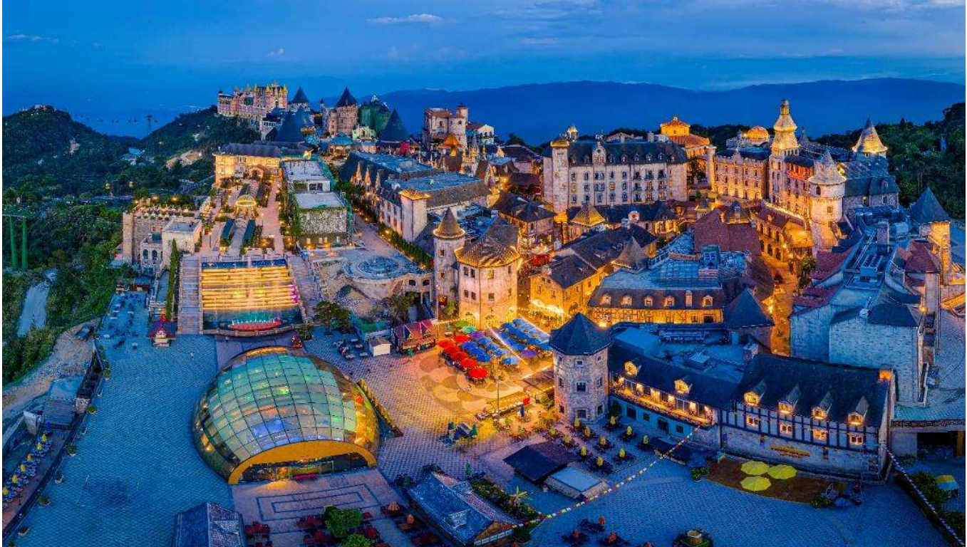
T2G-DAD01VZ Exclusive Danang BanaHill... ดานัง ฮอยอัน บาน่าฮิลล์ 4 วัน 3 คืน (VZ) ไม่ลงร้าน