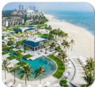
"พัก 5 ดาว HYATT DANANG 2 คืน"