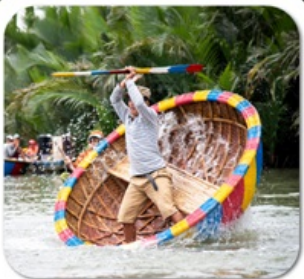
"ล่องเรือกระดัง"

นั่งกระเช้าที่ยาวที่สุดในโลก ขึ้นสู่บานาฮิลล์ • หมู่บ้านฝรั่งเศส • สวนสนุก FANTASY PARK LE JARDIN D'AMOUR • สะพานมือสีทอง • วัดหลินอึ้ง • เมืองโบราณฮอยอัน หมู่บ้านกิมกาน • ล่องเรือกระดัง • สะพานมังกร • APEC PARK • ตลาดฮาน