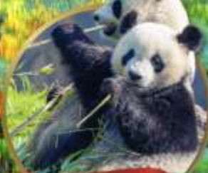
หมี่แพนด้าตู่เจียงเยิน