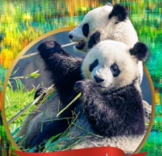
หมีแพนด้ายักษ์เจียงเยียน