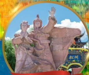
เมืองโบราณชงฟาน