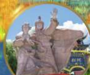
เมืองโบราณชงพาน