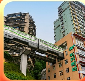
“นั่งรถไฟทะลุตึก”