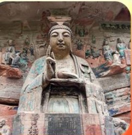
“ผาหินแกะสลักต้าจู้”