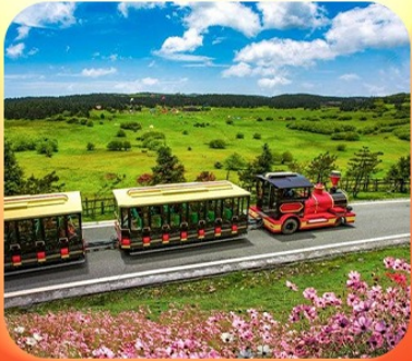
“อุทยานเขานางฟ้า”

บินตรงลงชิง • อุโมงค์ หลุมฟ้าสะพานสวรรค์ • ระเบียบแก้ว • อุทยานเขานางฟ้า หงหยาดัง • นั่งรถไฟทะลุตึก • ล่องเรือชมดวงชิงยามค่ำคืน • ศาลาประชาคม (ด้านนอก) มรดกโลกผาหินแกะสลักต้าจู้ • เมืองโบราณสี่ปาตี • วัดหลิวฮั่น • ตึกตะเกียบ