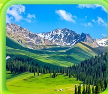
"กุ้งหน้านาราตี"