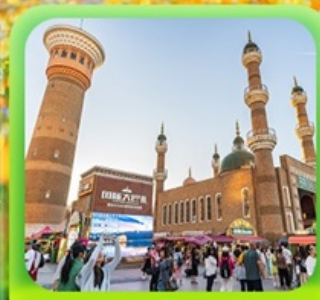
"ตลาดต้าปาจา"

ซินเจียงเหนือ ทะเลสาบไซลีมู่ "น้ำตาหยดสุดท้ายของแอตแลนติก" • กุ้งหน้านาราตี กุ้งดอกไม้เทียนซาน • ผ่านชมสะพานกั๋วจื่อโกว • ถนนหลิวซิงเจียง • ตลาดต้าปาจา