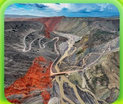
"แกรนด์แคนยอนคู่ชานจื่อ"

ซินเจียงเหนือ ทะเลสาบไซลีมู่ "น้ำตาหยดสุดท้ายของแอตแลนติก" • กุ่มหญ้านาราที กุ่มดอกไม้เทียนซาน • ผ่านชมสะพานกั๋วจื่อโกว • ถนนหลิวซิงเจียง • ตลาดต้าปาจา