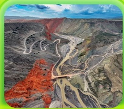
"แกรนด์แคนยอนคู่ขนานจื่อ"

ซินเจียงเหนือ ทะเลสาบไซลีมู่ "น้ำตาหยดสุดท้ายของแอตแลนติก" • กุ้งหน้านาราตี กุ้งดอกไม้เทียนซาน • ผ่านชมสะพานกั๋วจื่อโกว • ถนนหลิวซิงเจียง • ตลาดต้าปาจา