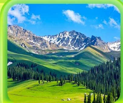
"กุ่มหญ้านาราที"