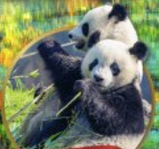
หิมะแพนด้ายักษ์ปิ่นตึก