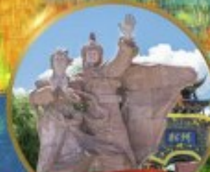
เมืองโบราณชงฟาน