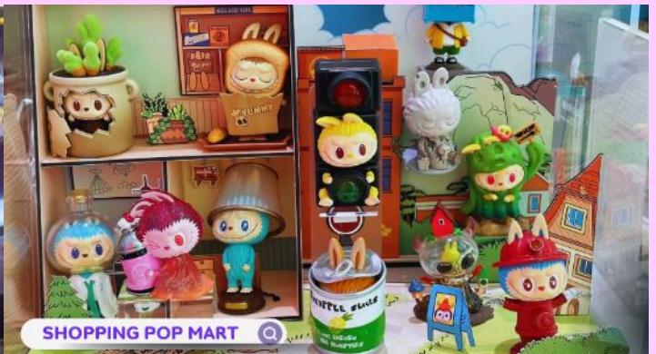
POP MART ช้อปปิ้งถนนนานกิง